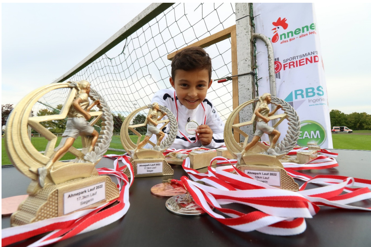
Pokale für die Hauptläufe