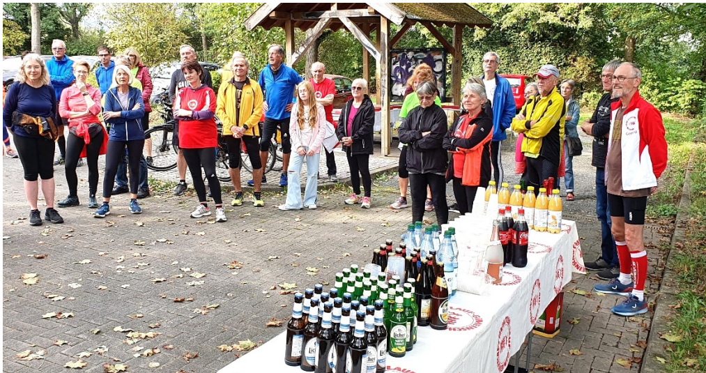
Getränke stehen bereit