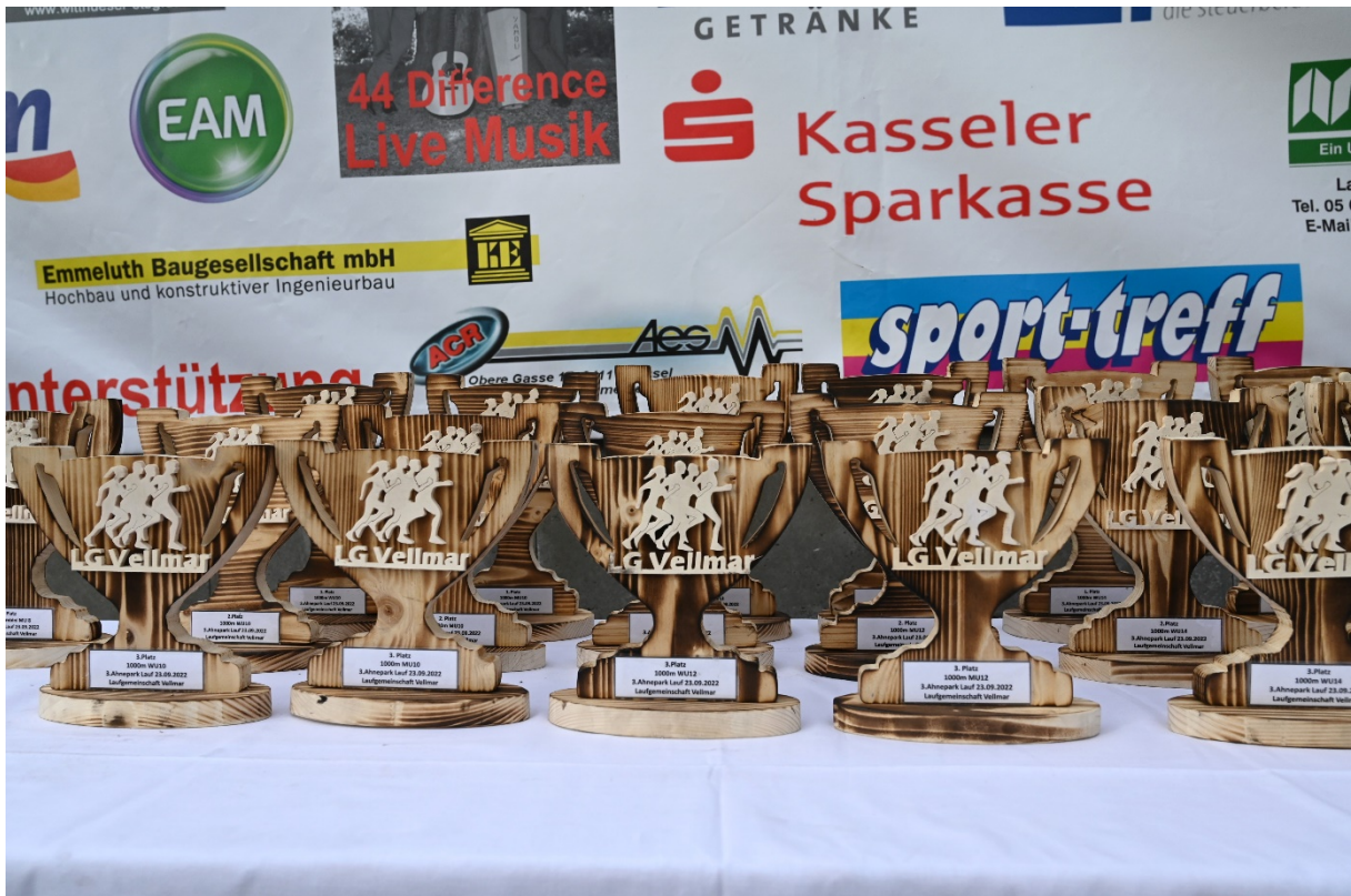
Die Pokale für die Bambinis und Schulkinder