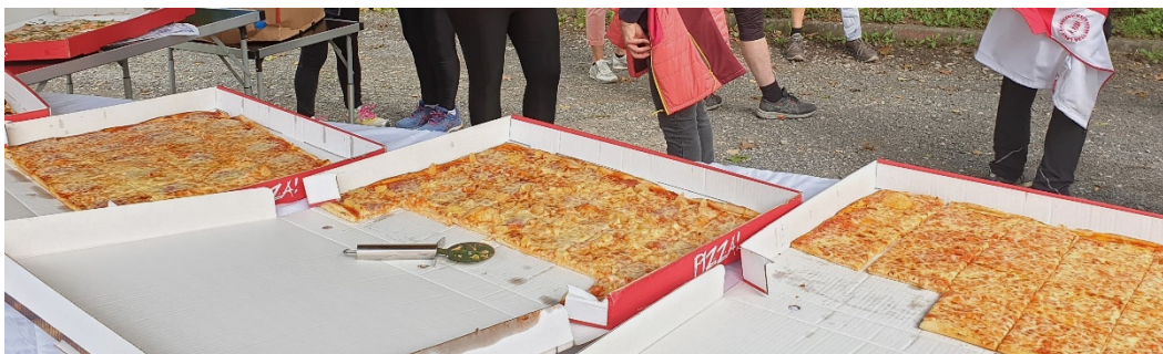
Guten Appetit bei den Pizzen