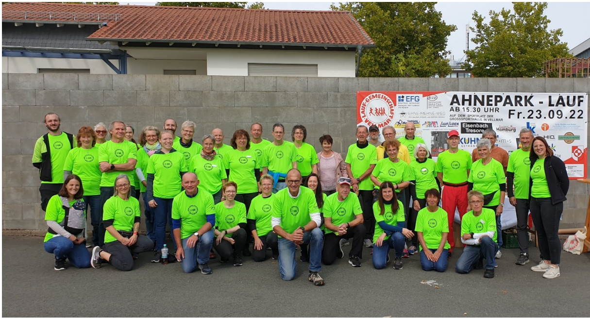
Allen Helferinnen und Helfer ein riesengroßes Dankeschön