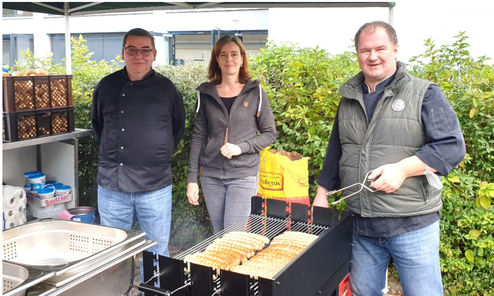
„Die drei vom Grill“ (Gasthof Henze)