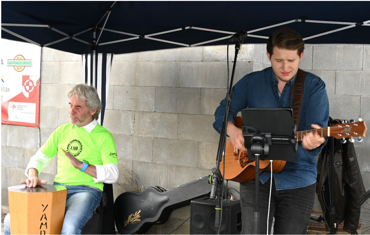
Die Musiker-44 Difference-