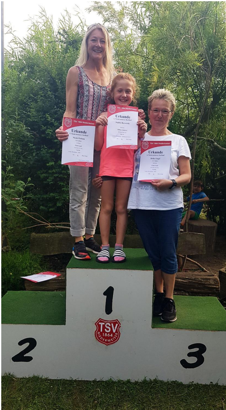
Zufriedene Gesichter beim NiedermeiserDorflauf