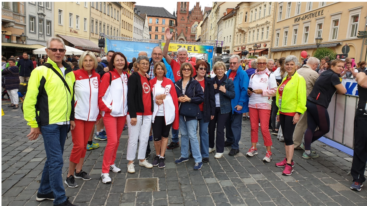
Gruppenbild mit einigen Aktiven und LGV-Fans