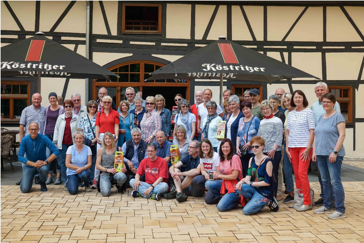
Die LGV beim Besuch der Brauerei