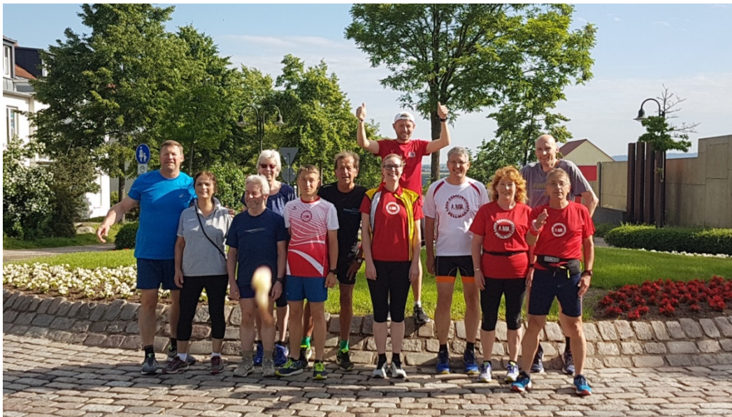
Der Herkules rief- und rauf auf den Berg