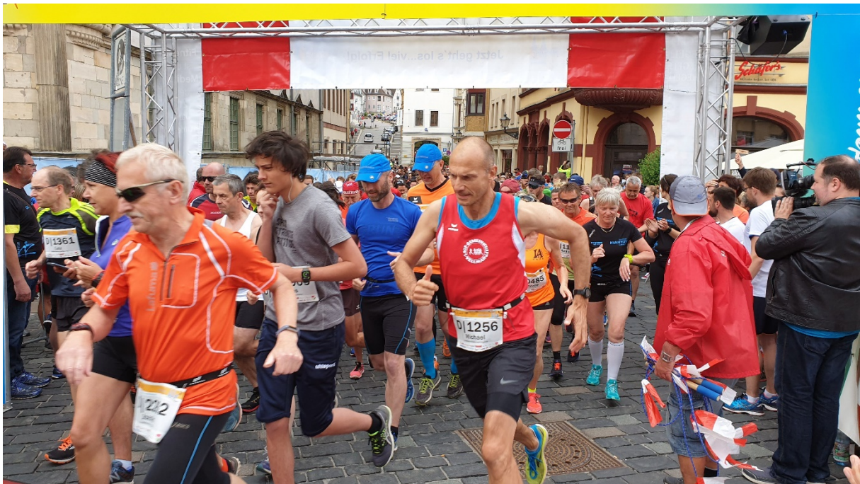
Start zum 13,3 km Lauf