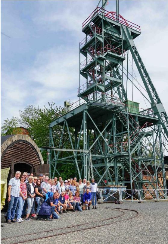
Die Gruppe am Förderturm